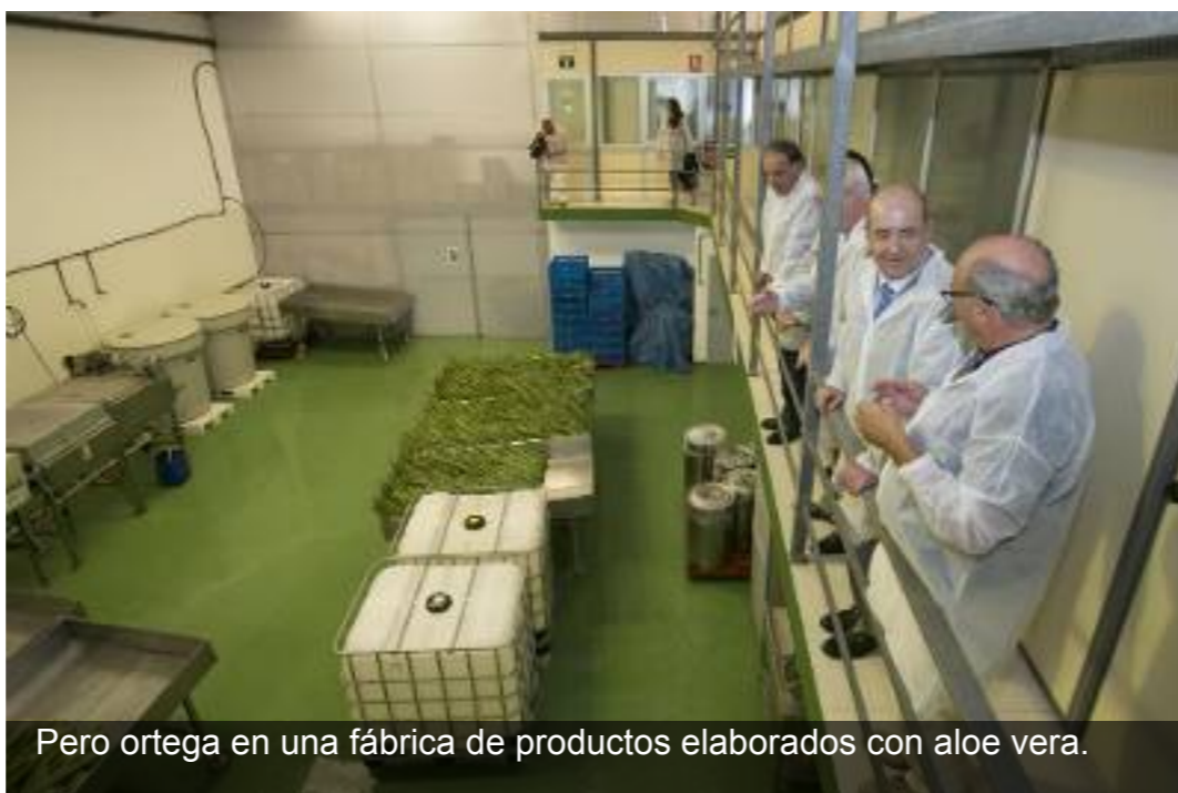
Pedro Ortega en una fábrica de productos elaborados con aloe vera.

El consejero de Economía, Industria, Comercio y Conocimiento del Gobierno de Canarias, Pedro Ortega, destacó la necesidad de impulsar la producción y comercialización de los productos elaborados con aloe vera en Canarias como una vía para contribuir a diversificar e incrementar el desarrollo industrial y generar empleo cualificado en las islas.